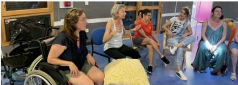
Durant la résidence, les artistes ont réalisé des ateliers avec les résidents, avant de restituer l'avancée de la création du spectacle, lors d'une représentation ce jeudi 20 juillet.

Trois artistes ont élu résidence afin de lancer un travail créatif avec les résidents.