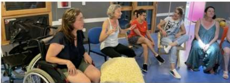
Durant la résidence, les artistes ont réalisé des ateliers avec les résidents, avant de restituer l'avancée de la création du spectacle, lors d'une représentation ce jeudi 20 juillet.

Trois artistes ont élu résidence afin de lancer un travail créatif avec les résidents.