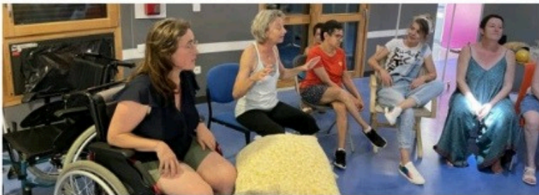
Durant la résidence, les artistes ont réalisé des ateliers avec les résidents, avant de restituer l'avancée de la création du spectacle, lors d'une représentation ce jeudi 20 juillet.

Trois artistes ont élu résidence afin de lancer un travail créatif avec les résidents.