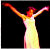
Terre...2005, Centre Culturel, Oullins.

Pour offrir un livre est la 9 e création de la compagnie . Ses créations allient toujours à la danse, l'objet, la voix, et d'autres disciplines artistiques : un théâtre physique et chorégraphique.