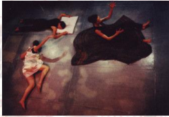
Défi 'dances, 1999, Centre culturel. Villeurbanne.

Ephémère , créé en 1997, à Lyon, fût au départ un collectif d'artistes improvisateurs avec ses Défi 'dances. Depuis 2001, elle développe la création, la diffusion, la transmission pédagogique.