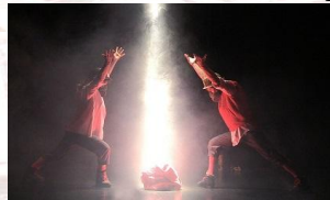
Volcans, 2015-16, Salle des Rancy, Lyon.